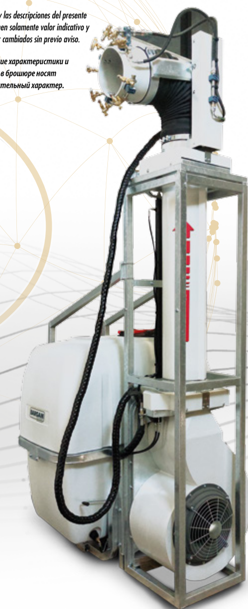
TURBO POLI 45 FLEX PIRALIDE 440 - 630 - 830 - 1100