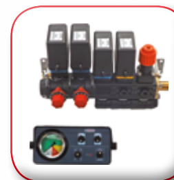
KIT COMANDO ELETTRICO ELECTRICAL CONTROL UNIT KIT DISTRIBUTEUR ELECTRIQUE ELEKTRISCHES BEDIENUNG KIT MANDO ELÉCTRICO КОМПЛЕКТ ЭЛЕКТРИЧЕСКОГО УПРАВЛЕНИЯ