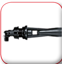
AGITATORE IDRAULICO STANDARD STANDARD HYDRAULIC AGITATOR AGITATEUR HYDRAULIQUE STANDARD STANDARD HYDRAULISCHER AUFRÜHRER AGITADOR HIDRÁULICO STANDARD СТАНДАРТНЫЙ ГИДРАВЛИЧЕСКИЙ ШЕЙКЕР