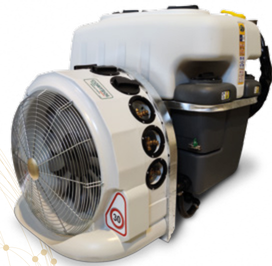
POLI 70 CONTROL 330 - 440 - 440 B 630 - 830 - 1100