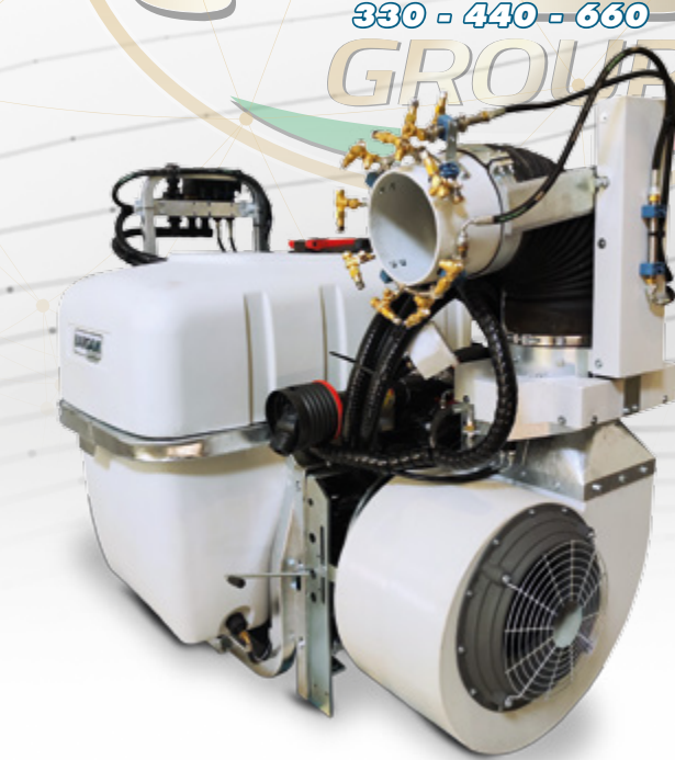
TURBO POLI 45 FLEX L 440 - 630 - 830 - 1100