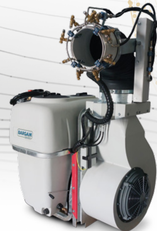
TURBO POLI 45 FLEX 440 - 630 - 830 - 1100