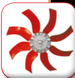
ELKA CONTROL FAN VENTILATEUR CONTROL CONTROL LÜFTER VENTILADOR CONTROL КРЫЛЬЧАТКА