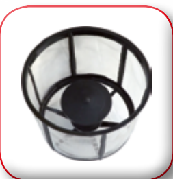
MISCELATORE POLVERI PRE-MIXER PRÉLAVAGEUR DOSE WÄSCHE МЕЗЛАДОР DE POLVOS СМЕШИВАНИЙ ПОРОШКОВ