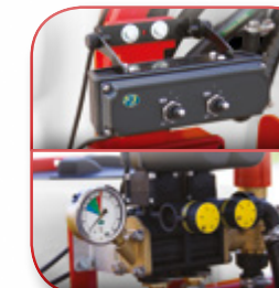
GRUPPO DI COMANDO DUE VIE ELETTRICHE PROPORZIONALE TWO-WAY PROPORTIONAL ELECTRIC CONTROL UNIT GRUPE DE COMMANDE DEUX VOIES ELECTRIQUES PROPORTIONNEL ZWEI ELEKTRISCHES WEGEN PROPORTIONAL BEDIENUNG GRUPO DE MANDO DE DOS VIAS ELECTRICAS PROPORCIONAL УЗЕЛ УПРАВЛЕНИЯ ДВУХВОДОВЫХ ПРОПОРЦИОНАЛЬНЫХ ЭЛЕКТРИЧЕСКИХ КЛАПАНОВ