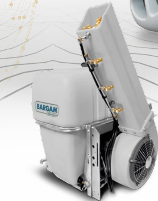
TURBO POLI 35 330 - 440 - 630