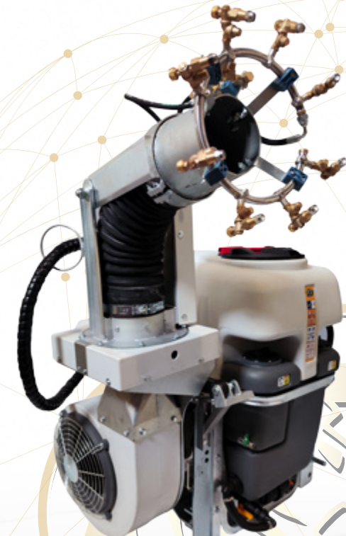
TURBO POLI 35 FLEX 330 - 440 - 630