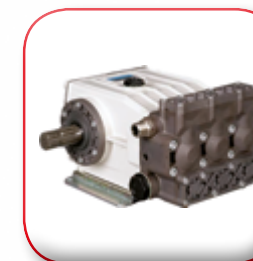
POMPA A PISTONI PISTON PUMP POMPE A PISTON KOLBEN PUMPE BOMBAS DE EMBOLOS ПОРШНЕВОЙ НАСОС