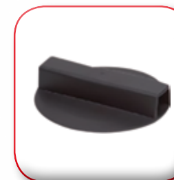
TAPPO GRV CONTROL GRV CONTROL CAP BOUCHON GRV CONTROL GRV CONTROL STÖPSEL TAPON GRV CONTROL КРЫШКА БЫСТРОРАЗЪЕМНОГО КРЕПЛЕНИЯ