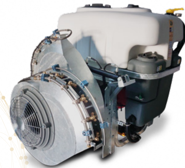
TURBO POLI 45 CHIOCIOLE 440 - 630 - 830 - 1100

A world of solutions - Un monde de solutions - Viele Lösungen Un montón de soluciones - Мир решений