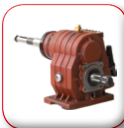
MULTIPLICATORE 2V 2V GEARBOX 2V MULTIPLICAUEUR 2V ÜBERSETZUNGSGETRIEBE 2V MULTIPLICADOR МУЛЬТИПЛИКАТОР 2V