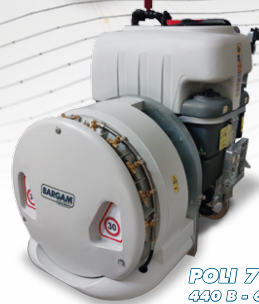
POLI 70 VIGNE 440 B - 630