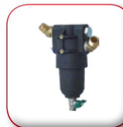
FILTRO AUTOPULENTE SELF-CLEANING FILTER FILTRE AUTONETTOYANT SELBSTPUTZ FILTER FILTRO AUTOLIMPIANTE САМООЧИЩАЮЩИЙСЯ ФИЛЬТР