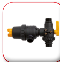
KIT FILTRO IN ASPIRAZIONE SUCTION FILTER KIT KIT FILTRE D'ASPIRATION ABSaugenFILTER KIT KIT FILTRO EN ASPIRACION КОМПЛЕКТ ВАКУУМНОГО ФИЛЬТРА