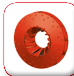
VENTILATORE PNEUS PNEUS FAN VENTILATEUR PNEUS PNEUS SCHAUFELRAD VENTILADOR PNEUS ВЕНТИЛЯТОР PNEUS