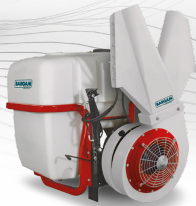
TURBO POLI 45 DOUBLE 440 - 630 - 830 - 1100