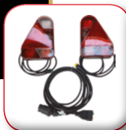
KIT ILLUMINAZIONE LIGHT SET KIT ECLAIRAGE BELEUCHTUNG KIT СИСТЕМА ИЛЛЮМИНАЦИИ ОСВЕТИТЕЛЬНЫЕ КОМПЛЕКТЫ