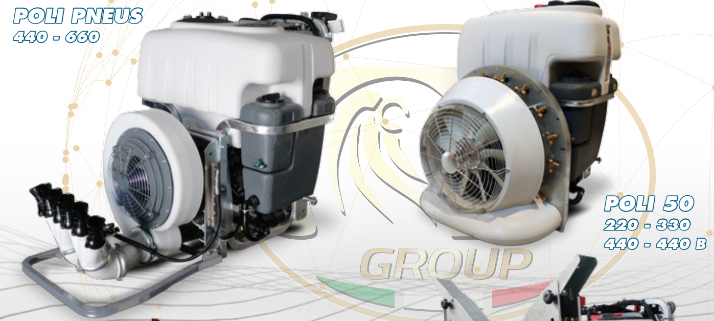
POLI 50 220 - 330 440 - 440 B