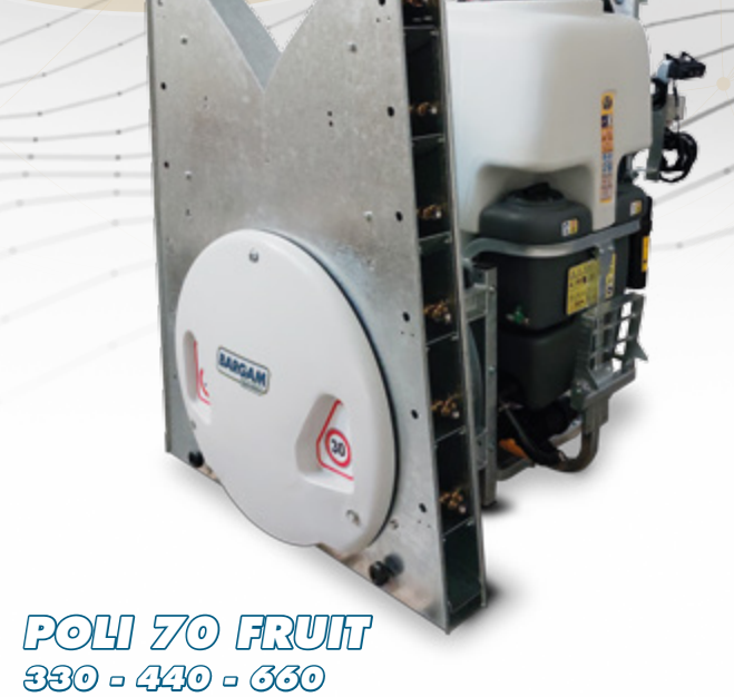
POLI 70 FRUIT 330 - 440 - 630