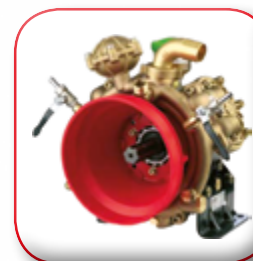
POMPA IN BRONZO BRONZE PUMP POMPE EN BRONZE BRONZE PUMPE BOMBA EN LATÓN БРОНЗОВЫЙ НАСОС