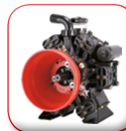
POMPA IN ALLUMINIO ALUMINIUM PUMP POMPE EN ALUMINIUM ALUMINIUM PUMPE BOMBA EN ALUMINIO АЛЮМИНИЕВЫЙ НАСОС