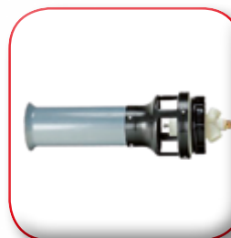
AGITATORE IDRAULICO HYDRAULIC AGITATOR AGITATEUR HYDRAULIQUE HYDRAULISCHER AUFRÜHRER AGITADOR HIDRÁULICO СТРУЙНОГО ПЕРЕМЕШИВАНИЯ