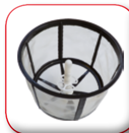
LAVABARATOLI CAN CLEANER PRÉLAVAGEUR BELEUCHTUNG KIT МОЮЩЕЕ УСТРОЙСТВО