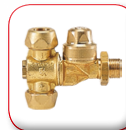
GETTO DOPPIO DOUBLE NOZZLE BIJETS ZWEIFACHDÜSE DOBLE BOQUILLA ДВОЙНАЯ СТРУЯ