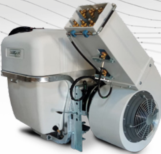
TURBO POLI 45 440 - 630 - 830