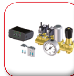
KIT COMANDO ELETTRICO ON-OFF ON-OFF ELECTRICAL CONTROL UNIT DISTRIBUTEUR ELECTRIQUE ON-OFF ON-OFF ELEKTRISCHES BEDIENUNG MANDO ELÉCTRICO ON-OFF КОМПЛЕКТ С ЭЛЕКТРИЧЕСКИМ ВКЛ ВЫКЛ