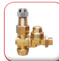
GETTO DOPPIO CANNONCINO DOUBLE AIR-INJECTOR NOZZLE DOUBLE BUSE A CANON ZWEIFACHKANONDÜSE BOQUILLAS DE CANON ДВОЙНОЙ СТРУЙНЫЙ ПИСТОЛЕТ